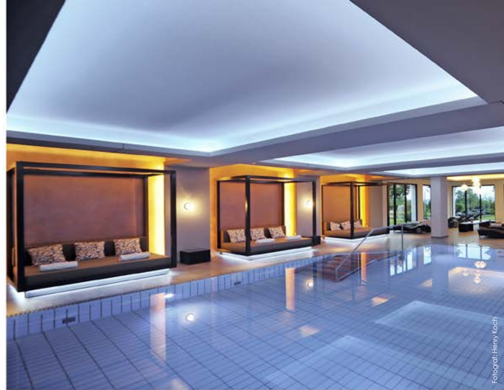
Von Reuter erfrischend in Szene gesetzt: Der Spa Bereich des Schlosshotels Bad Wilhelmshöhe