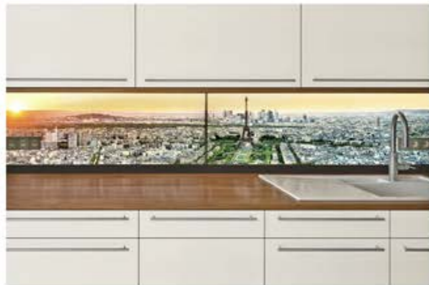
Küchenzeile mit feuchtigkeitsbeständigem LED-Display

Besonders stolz ist der Elektroingenieur auf die nur vier Millimeter starken und damit weltweit flachsten LED-Paneele. Diese Produkte werden im eigenen Haus produziert. Die Produktpalette reicht von doppelseitig beleuchteten Stellwänden über großformatige RGB Leuchtdecken bis zu komplexen Leucht- und Wegeleitsystemen. Trotz dieser Vielzahl an Präsentationssystemen werden auch immer wieder Sonderlösungen angefragt. „Als Entwickler mag ich es, ausgefallene Kundenwünsche zu realisieren. Das hat sich besonders in der Branche herumgesprochen, zur Freude des Tüftlers und zum Wohle der Kunden.“