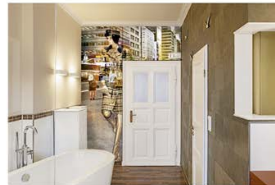
Originell und dekorativ: Raumhohes New Yorker Wandbild